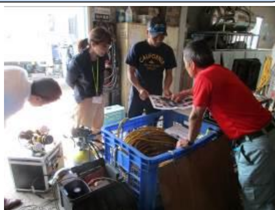
事前リハーサル (海中カメラ機材下見)