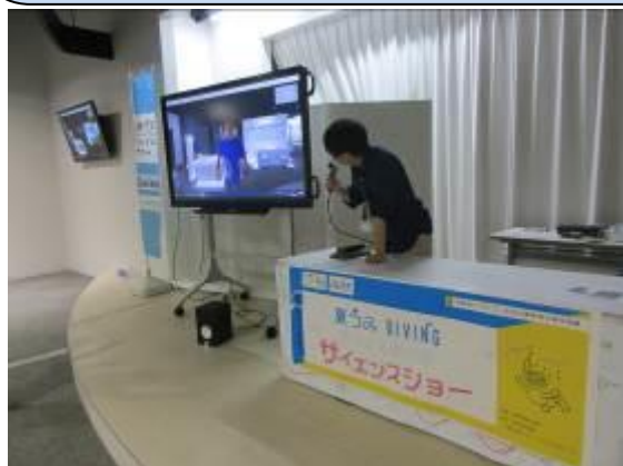
前日リハーサル (ショーステージ)