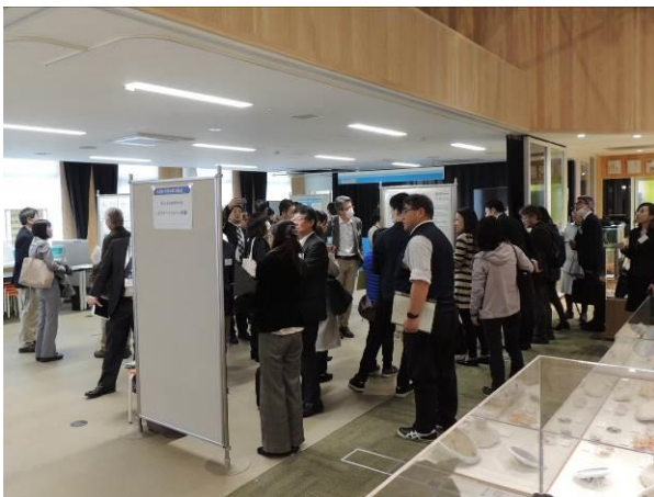
開催場所の全景の様子