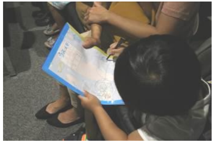
参加ノベルティをもらった子どもの様子

ダイバーが海水に入る準備（着替え）の様子を導入に使用した。海中で呼吸するためには装備が必要であること、うまく浮力を操るのも背負ったタンクが重要であることを学んだ。参加ノベルティーは、博多湾の実物大生物シルエットと定規が付いていて、海で発見した生物などをえんぴつでメモできるクリアファイルとした。