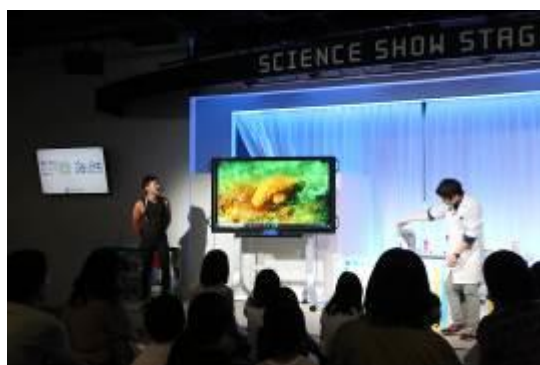
実施状況写真③（ハイライト）