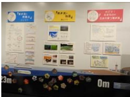
博多湾紹介パネル