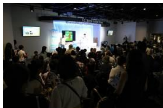
実施状況写真④（ハイライト）