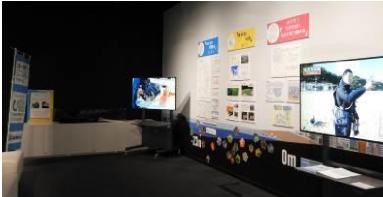
実施状況写真①（ハイライト）