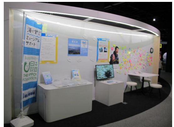
実施状況写真②（ハイライト）