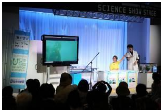
海中との中継をしながら実験している様子