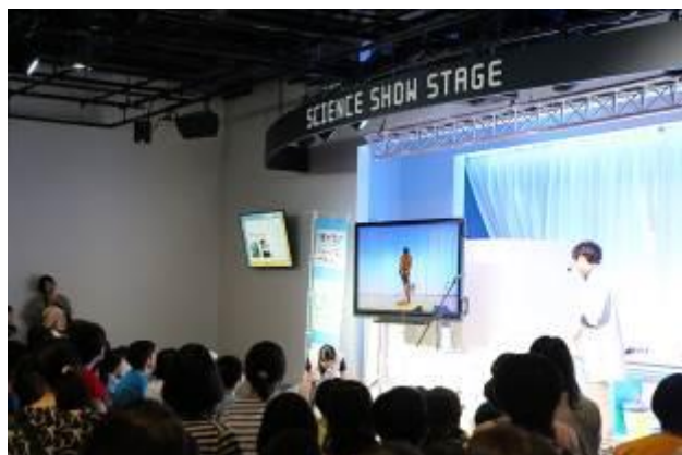
着替えVTRを使った導入