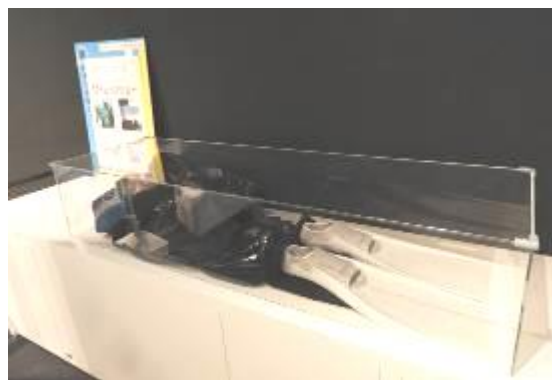
ダイバースーツの展示