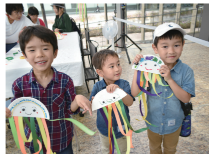
長崎県美術館 (2017年度事業)