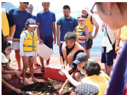
青函連絡船メモリアルシップ八甲田丸 (2015年度事業)