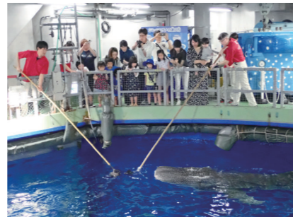
いおワールド かごしま水族館 (2019年度事業)