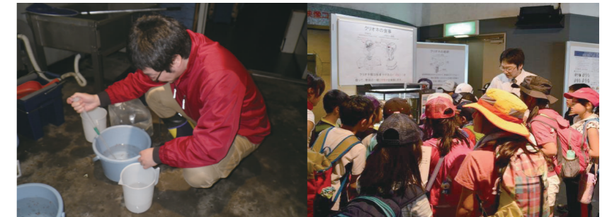
蘭越町貝の館 (2015年度事業)