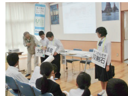
南さつま市坊津歴史資料センター輝津館 (2015年度事業)

学校教育現場と社会教育施設の連携による、次世代への海をテーマにした新たな学びの機会をサポート。