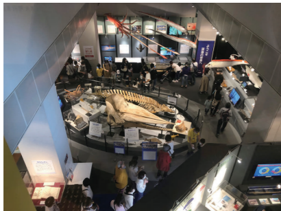
ミュージアムパーク茨城県自然博物館 (2020年度事業)

あなたの館ならではの切り口で、「海の学び」を生む企画展の資金をサポート。企画展及び関連するイベントもサポートします。