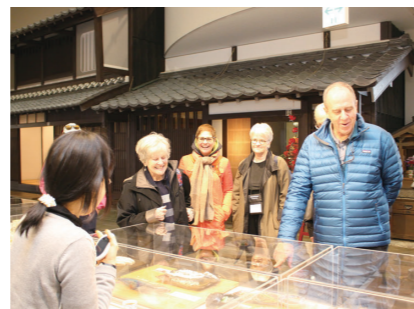
御食国若狭おばま食文化館 (2019年度事業)