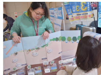
北海道大学総合博物館 (2019年度事業)

なお、これらのテーマについては、当該年度以降もプログラム2「海の博物館活動サポート」で募集をしておりますので、お気軽に事務局までご相談ください。