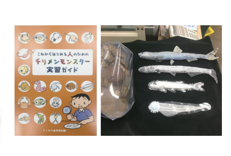
きしわだ自然資料館 (2018年度事業)