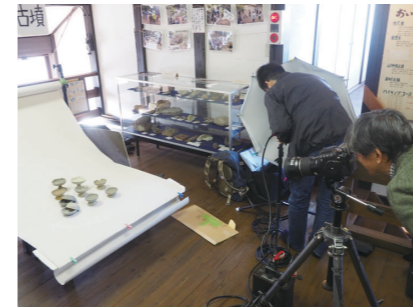
名古屋市博物館 (2017年度事業)

あなたの館ならではの、オリジナリティのある「海の学び」をカタチにするために。準備のための調査・研究活動の資金をサポートします。