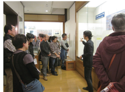
千葉県立関宿城博物館 (2017年度事業)