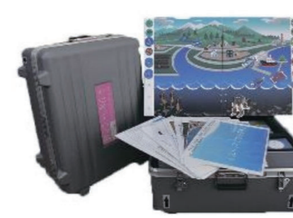
様似郷土館 (2018年度事業)