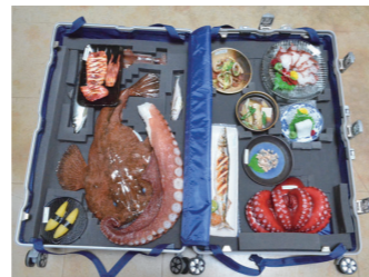
青森県営浅虫水族館 (2019年度事業)