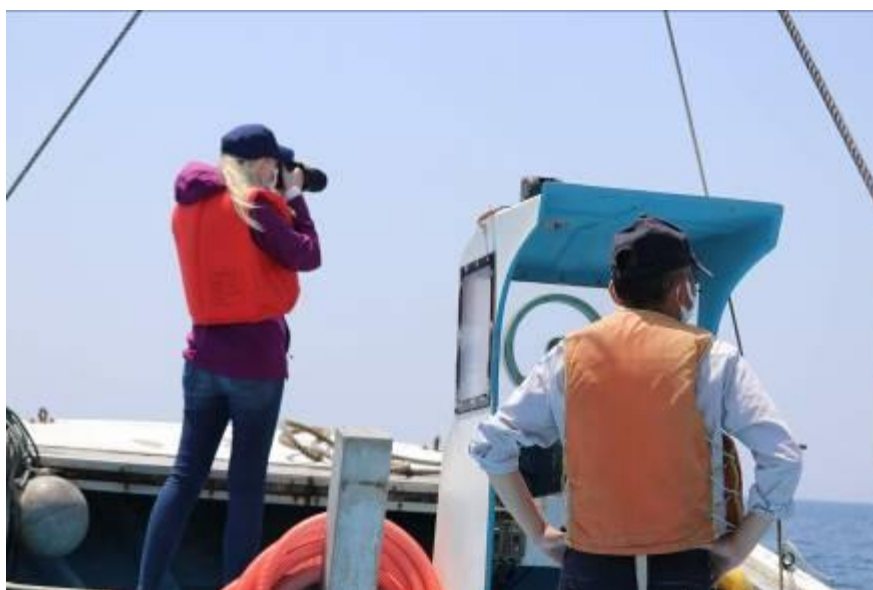
予備調査の様子 日々変わるイルカの群れの出現場所の予測や生態の記録を行った。

コロナウイルスの影響でトライアルの実施は一回のみに留まるなど、当初の計画の通りには行かなかったが、この予備調査でトライアル用にイルカの今シーズンの出現場所が予測でき、これで得た生態記録は、学習用教材の開発やSNSでの啓蒙教育活動といった成果物へと繋がった。また次年度以降の本格実施に向けて遭遇率向上につながる良い参考データとなるなど、結果的に意図した本来の目的を果たした。