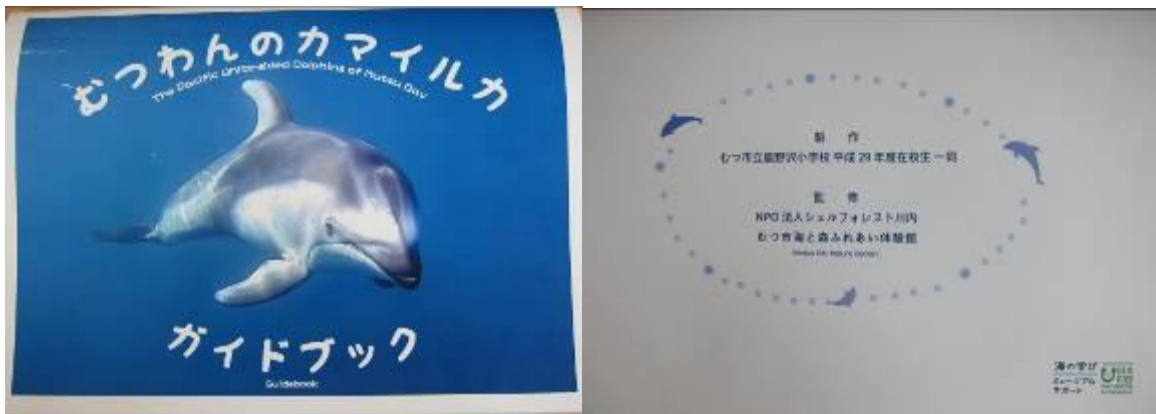
学習用テキストガイドブック