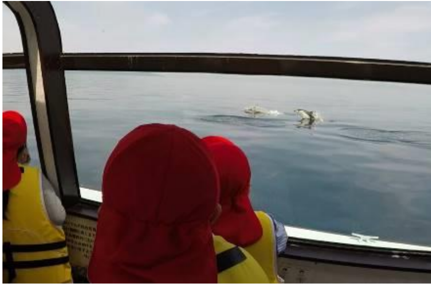
陸奥湾でのトライアル実施 むつ市立脇野沢小学校 2020年6月1日 (むつ市遊覧船)