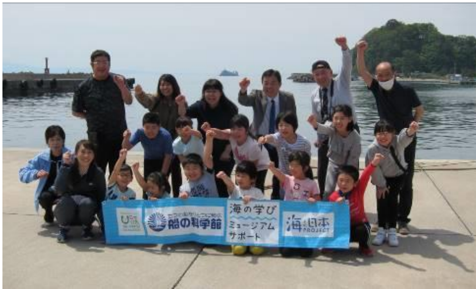
むつ市立脇野沢小学校とのイルカ観察 (2020年6月1日、脇野沢港にて)

全児童12名と先生方と。校長先生はじめとする関係者の皆様のご理解とご協力のもと、新型コロナウイルスなどへの安全対策をしっかり行い(消毒、マスク、救命具等)、特別に運行いただいたむつ市の遊覧船に3密を避けて乗船、観察しました。